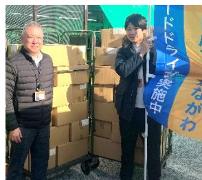
神奈川大学 みらいキャンパス 様