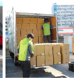
三菱電機労働組合 東部研究所支部様