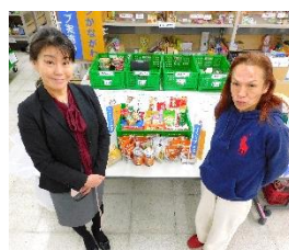
元町ライオンズクラブ 様