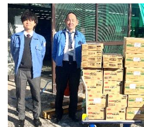
アツギ (株) 様