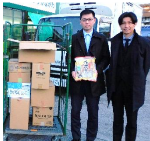
中地区教職員組合 様