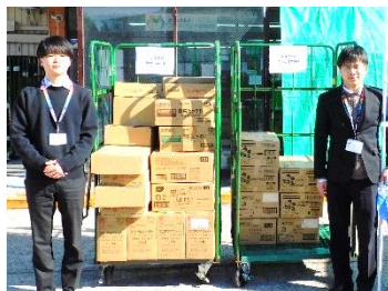
神奈川県庁 様 (テレビ神奈川様分も一緒に)