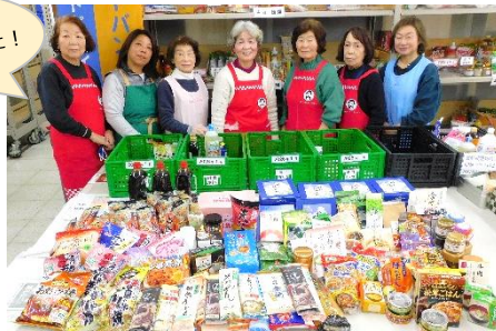
JA 横浜 都岡支店 様