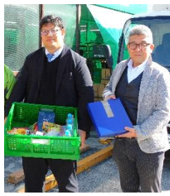
三浦半島地域連合・労協様