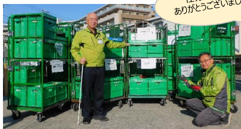
パルシステム神奈川 様 全配送センターでフードドライブを実施！