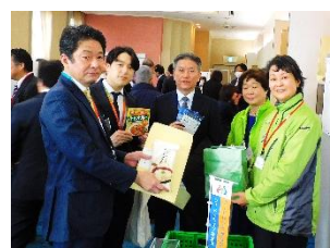
神奈川県生協連 様 賀詞交歓会