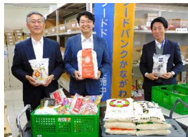
中央労働金庫 横浜支店 推進幹事会様