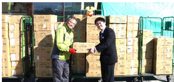
神奈川中央交通 (株) 様