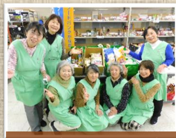
生長の家 神奈川県白鳩会 様

その他 定期的に支援に来てくださっている団体の皆さま (浜っ子南、神奈川フードバンク・プラス、奉仕大好きグループ、みなみわかちあいの会)、 また、仕分け体験グループの支援をしてくださった個人ボランティアの皆さま、いつもありがとうございます！