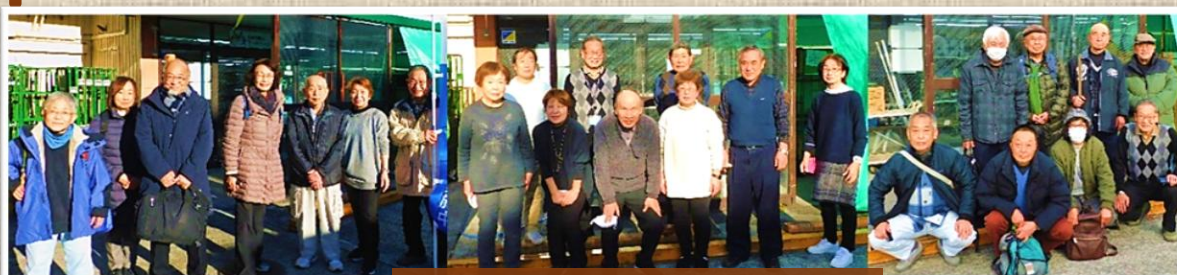
シニア連合 様 (3グループ)