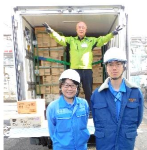
旭化成 労働組合 様